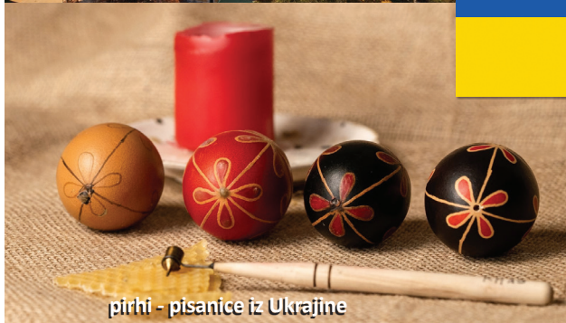
pirhi - pisanice iz Ukrajine