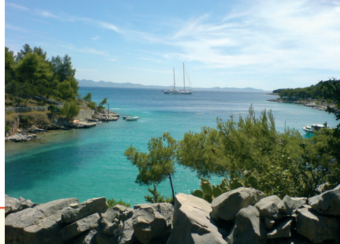
Zaliv na Braču