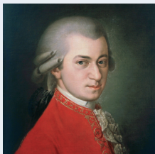
Wolfgang A. Mozart