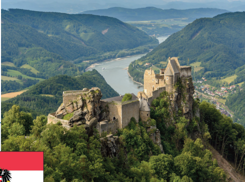
Wachau, dolina Donave